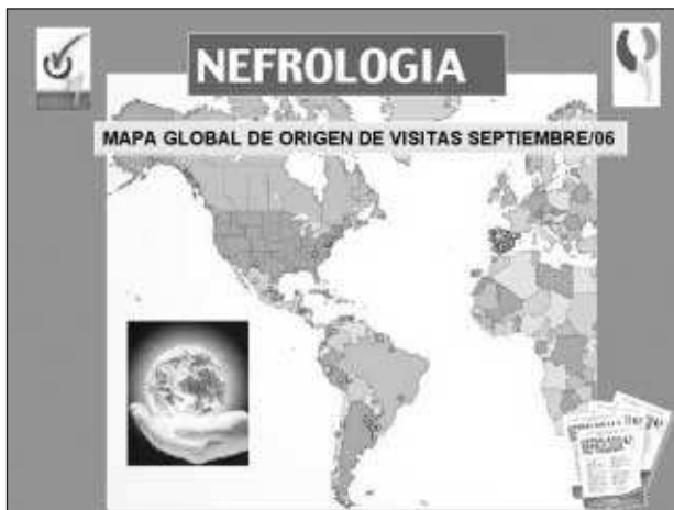
Fig. 7.—Mapa global de las visitas a la web de Nefrología. Septiembre 2007.

contribuciones procedentes de Latinoamérica tienen un carácter no homogéneo ya que, mientras que algunas son de una calidad excelente, otras no están al nivel de las publicaciones españolas en cuanto a metodología, casuística o presentación y esto hace que los revisores desechen su publicación con mayor frecuencia que para los escritos de España. Se intenta no obstante aprovechar al máximo esta participación, reconvirtiendo en comunicaciones breves, cartas al editor o con reconsideraciones profundas de los escritos hasta que son admitidos.