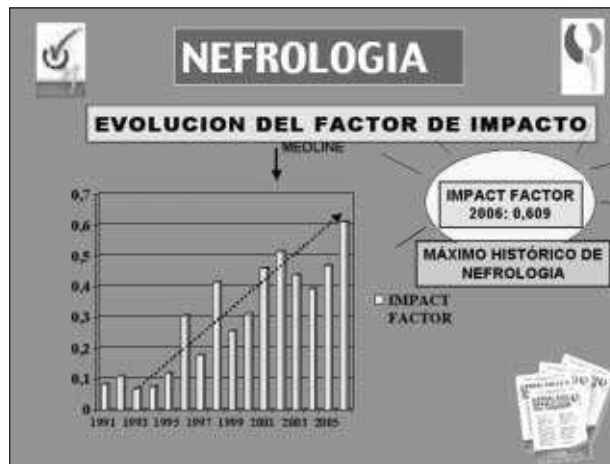
Fig. 9.—Evolución del factor impacto Nefrología.

La evolución del número de visitas a la página web de NEFROLOGÍA es muy positiva: se ha multiplicado por 12 desde la puesta a punto definitiva de la misma. En el momento actual alcanzamos alrededor de 40.000 al mes, es decir más de 1.000 al día, mientras que el promedio anual se ha multiplicado por dos desde el pasado año, con un promedio de 3 pági-