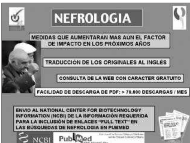
Fig. 10.—Medidas que aumentarán el factor de impacto de Nefrología en los próximos años.

Ello ha sido posible gracias al acuerdo estable mantenido entre la SEN y la editorial AULA MÉDICA, que ha persistido en épocas de bonanza económica y en épocas no especialmente favorables para los patrocinios publicitarios como la que vivimos actualmente. Este hecho es especialmente relevante en un momento de gran expansión de los servicios prestados a través de Internet y del notable aumento del volumen de publicación producido en los últimos años.