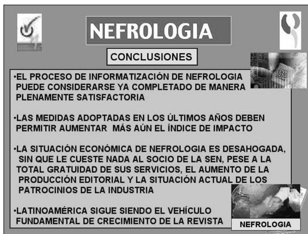
Fig. 12.—Conclusiones gestión Nefrología.

pensador argentino tenía bastante razón. Supongo que para algunos miembros de la SEN, estos 21 años de dirección de NEFROLOGÍA, han tenido visos de eternidad y eso es bueno porque significa tener más razones todavía para ayudar al nuevo equipo de dirección y hacer de nuestra revista un producto cada día mejor y más renovado. Para mi han sido los más productivos de mi vida profesional y como tales, se han pasado en un suspiro, como todas las cosas que verdaderamente se disfrutan y merecen la pena. De ahí la licencia del título de tango que encabeza este editorial.