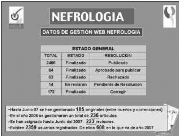
Fig. 5.—Datos de gestión de la web de Nefrología.

llo y con las lógicas dificultades iniciales que se fueron solventando y el progresivo acostumbramiento de los usuarios de la revista, en el momento actual se puede decir que funciona de manera satisfactoria y equiparable a la de otras revistas internacionales. Para la dirección de la revista ha supuesto una agilización del proceso y una facilitación de todos los trámites, además de un abaratamiento de los costes dado el precio progresivo del correo, en especial los envíos a Latinoamérica. La asistencia técnica por parte de la Editorial, puede calificarse como adecuada, solucionándose en general las incidencias registradas en un plazo corto. Las incidencias más comunes estuvieron relacionadas con la forma de corregir artículos para publicar, el envío de tablas o figuras y consultas sobre la fecha de publicación de artículos.