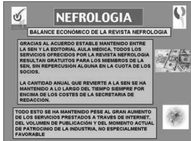
Fig. 11.—Balance económico de la revista Nefrología.

En definitiva, el proceso de informatización de la gestión de NEFROLOGÍA puede considerarse ya completado de manera plenamente satisfactoria. El índice de impacto se encuentra en máximos históricos y las medidas adoptadas en los últimos años, en especial la libre disponibilidad de los contenidos en la web, la traducción de los originales al inglés y la inclusión de enlaces fulltext en pubmed, permiten augurar un aumento progresivo en los próximos años. La situación económica de la revista es totalmente desahogada y no repercute para nada en la cuota de los miembros de la SEN pese a la gratuidad de todos sus servicios. Latinoamérica está siendo el campo natural de expansión de NEFROLOGÍA y sigue representando nuestro objetivo fundamental. La expansión de la revista a América Latina es hoy viable gracias a las nuevas tecnologías, fundamentalmente a la gestión informática y la presencia de los originales en la red. Ello hace aconsejable promover una mayor participación de los nefrólogos de aquel continente, creando un Comité Editorial específico.